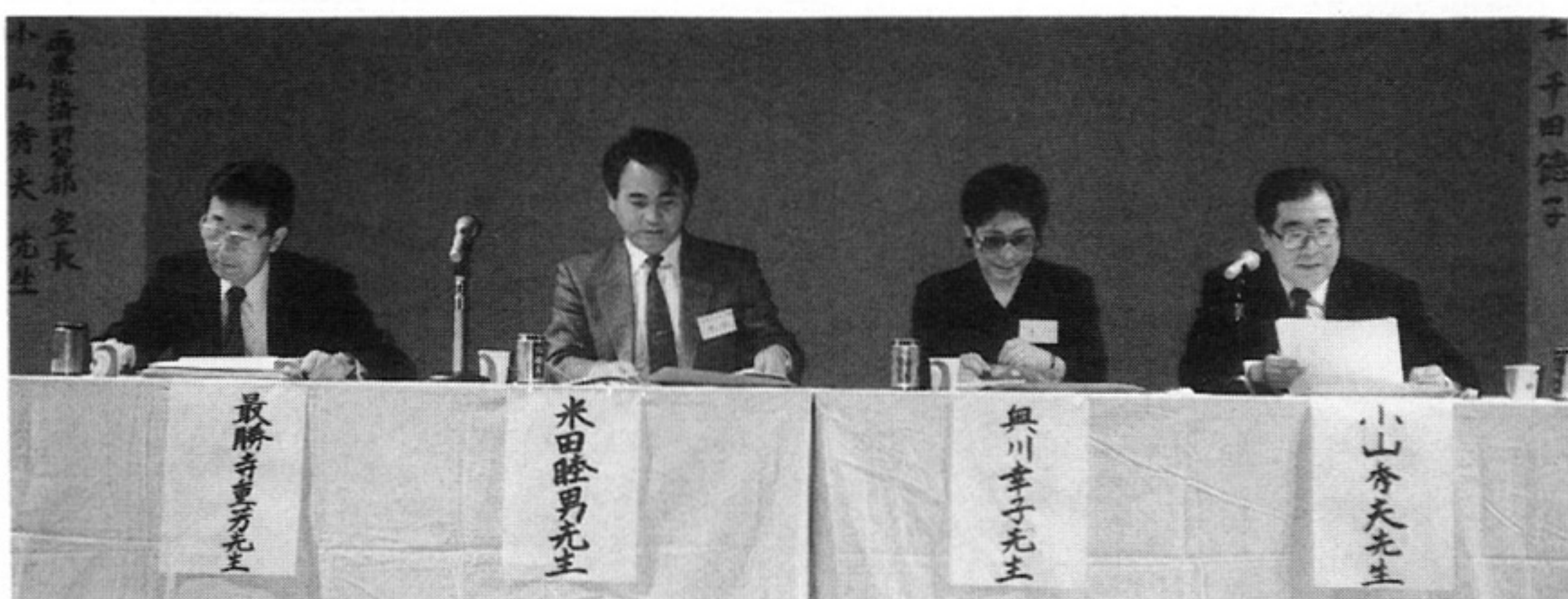
最勝寺 氏 米田 氏 奥川 氏 小山 氏